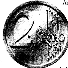
Der Einer und der Zweier enthalten jeweils 25 Prozent Nickel.

Ausschlag am ganzen Körper einer Patientin dürfte ein seltenes Phänomen sein, so Klein-Tebbe. Auch sei die primäre Sensibilisierung durch Euro-Münzen unwahrscheinlich. Vielmehr bestehe meist bereits eine Sensibilisierung durch andere Nickelhaltigen Gegenstände, vor allem Modeschmuck. Nur ständiger Kontakt mit nickelhaltigem Geld