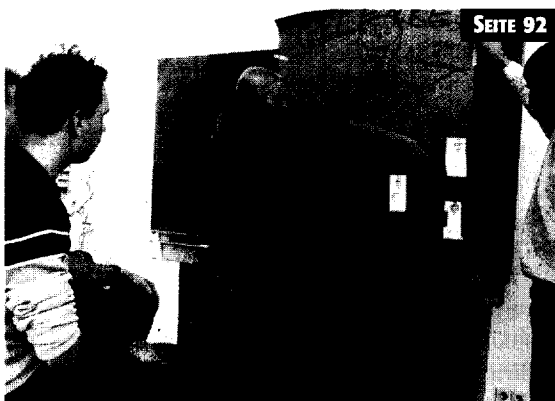
Die Schulen müssen ihren Unterricht noch besser auf die veränderte Praxis abstimmen

Nicht nur die Veränderungen im Gesundheitswesen, auch die gesellschaftlichen Wandlungsprozesse führen zu entscheidenden Umstrukturierungen in den Pflegeberufen. Die Autorin fordert die Entwicklung neuer Arbeitskonzepte, die dann auch die Ausbildung verändern.