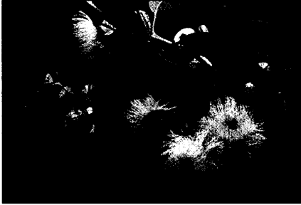
Titelfoto: Eucalyptus globulus von Margot Spohn