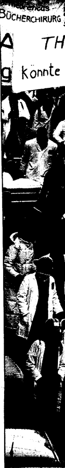
Protest gegen anderen Un