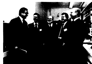
Auf biochemische Ansätze in der Zellbiologie soll sich die Forschung bei Phenion konzentrieren. Das neu gegründete Unternehmen ist ein Gemeinschaftsprojekt der Universität Frankfurt und des Henkel-Konzerns. Seite 58

Therapieempfehlungen, Broschüren-Download, »Medizinische Infothek«: Ein virtueller Besuch bei der Arzneimittelkommission der Deutschen Ärzteschaft lohnt sich. Seite 66