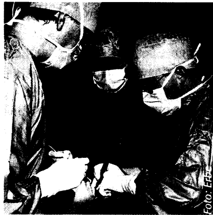
MT-Special: Das MT-Special geht dieses Mal ausführlich auf den Seiten 62-75 auf die HF-Chirurgie ein.