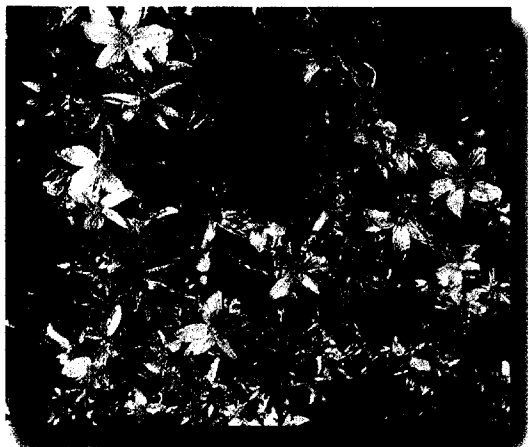
Johanniskraut als Antidepressivum. Seite 67