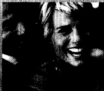
Statussymbol perfekte Zähne: Das Kooperationskonzept – Ästhetische Zahnheilkunde

Mit einer bislang einmaligen Patientenkampagne zum Thema ästhetische Zahnstellungskorrektur drängt ein neues Verfahren zur Erwachsenen-Kieferorthopädie auf den deutschen Markt. Das ZWP spezial beschreibt ein ausgeklügeltes Kooperationskonzept komplementärer Behandlungsangebote, das der wahlleistungsorientierten Praxis einen sanften Einstieg in die Welt der ästhetischen Zahnheilkunde ermöglicht.