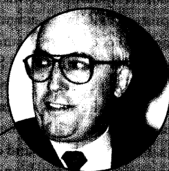
Beschcheidenheit im Auftreten, aber menschliche und fachliche Kompetenz bei der Erledigung unserer Aufgaben.