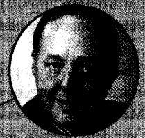
Packen wir's an