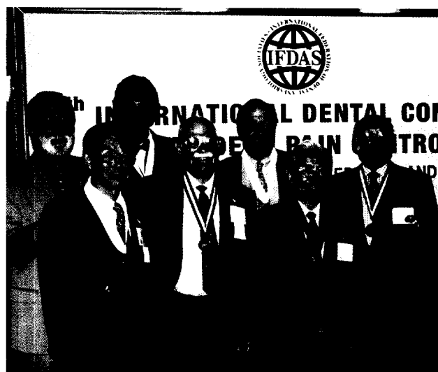
IFDAS-Weltkongress Jerusalem 2000: „Horace Wells Awards“ der Jahre 1994–2000. Seite 44