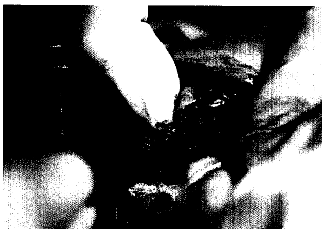
Oralchirurgische Eingriffe in Allgemeinanästhesie. Seite 22

16 Transgingivales Frialoc Schraubenimplantat und sofortige Belastung J. Schmidt, S. Bihl