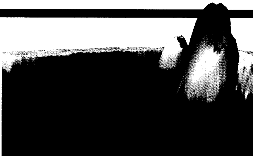
Keine Landschaft der virtuellen Welt, sondern eine fetthaltige Plasmamembran mit einzelnen hohen Membranproteinen: Mit Nanometer-Werkzeugen dringen Physiker in die Welten zellulärer Funktionen vor, die für Biologen von hohem Interesse sind. Seite 114