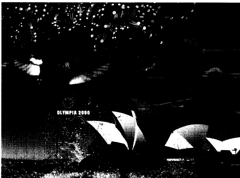
Bei den Olympischen Spielen in Sydney wurde erstmals ein neues Verfahren zum routinemäßigen Nachweis des Dopingmittels Erythropoietin eingesetzt – ein entscheidender Schritt im Kampf gegen Blutdoping. Seite 132