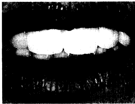
Teamplantologie: Step by step erleben Sie die Insertion von 18 Implantaten ab Seite 1993