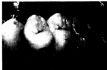
Um eine implantatgetragene Seitenzahnrestauration geht es in diesem Beitrag. Auch hier zeigte sich: eine perfekte Zusammenarbeit im Team ist Voraussetzung für ein gutes Ergebnis. Ab Seite 2005