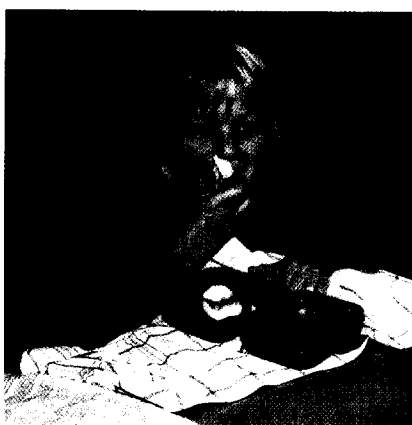
Bedeutung der Pausenverpflegung für die Zahngesundheit Seite 83