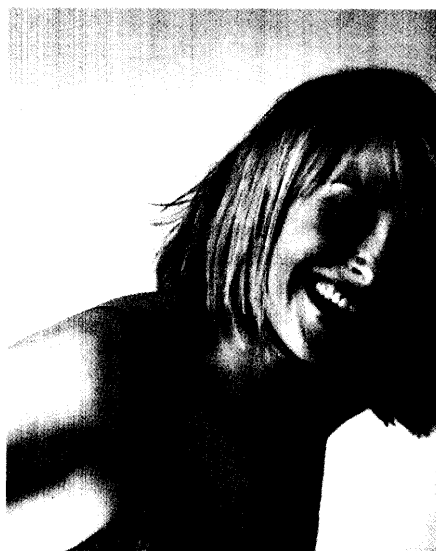
Gebißprothetik Ästhetik ist nachgefragt (Seite 28)