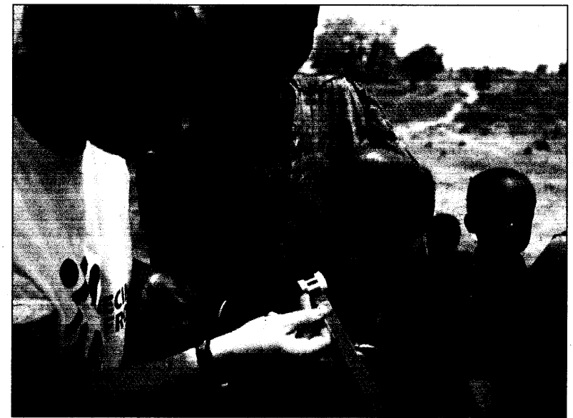
Eine Ärztin von Ärzte ohne Grenzen mißt im Sudan den Arm eines Kindes.

In der Beliebtheitsskala der Leistungserbringer rangieren mit 82 Prozent die Zahnärzte an der Spitze bei der gesundheitlichen Versorgung. Hausärzte und Fachärzte (68 und 67 Prozent) fallen dabei ab. Privat Versicherte sind noch weniger mit Hausärzten zufrieden. Das Krankenhaus bekommt nur von 48 Prozent bescheinigt, medi-