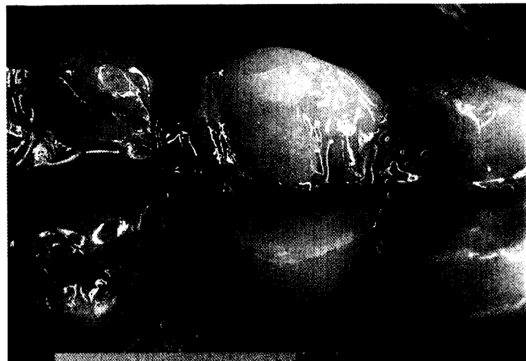
Implantatprothetik auf Gold-Titanpfosten Seite 402

Workshop zum biofunktionellen Prothetiksistem BPS 442