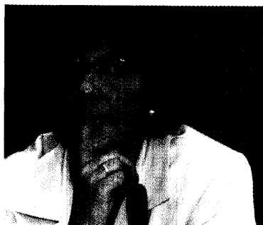
Dämpfer für Ulla Schmidt. Der Bundesrat will sich in diesem Jahr nicht mehr mit dem Arzneimittelausgaben-Begrenzungsgesetz befassen. Der Zeitplan für das Sparprogramm ist damit Makulatur. Seite 18

Die PZ-Redaktion wünscht allen Leserinnen und Lesern ein gesegnetes Weihnachtsfest und einen guten Rutsch ins neue Jahr. Die nächste PZ erscheint am 10. Januar 2002.