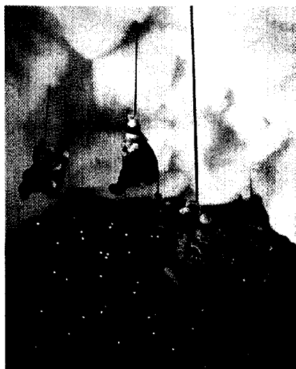
Eine originelle Idee aus Hessen: Zahnfreundliche Rezepte zum Nikolaustag.