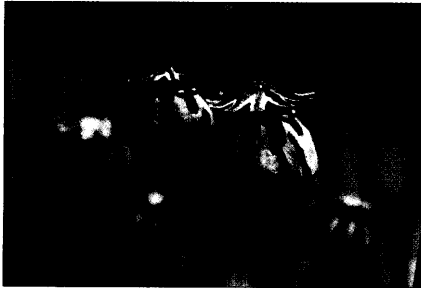
Titelfoto: Papaver somniferum – Schlaf-Mohn von Margot Spohn