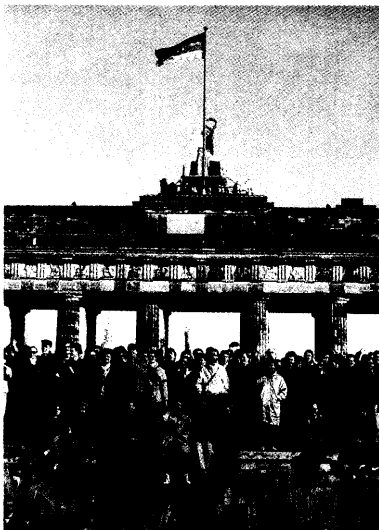
8. November 1989: Öffnung der Mauer als Krönung einer friedlichen Revolution in dem Gebiet der ehemaligen DDR. Was erwarten die Menschen jenseits dieser Grenze?

Nach einem Jahrzehnt: Wie hat die Unfall- versicherung die Wieder- vereinigung erlebt und gestaltet? 629