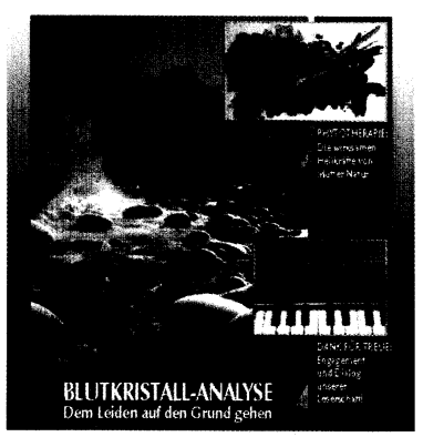
„Blatt“ der Top-Themen