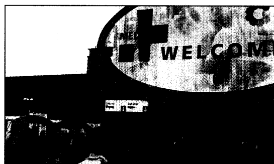
„Welcome“ zur Medica: Noch bis Samstag hat die M