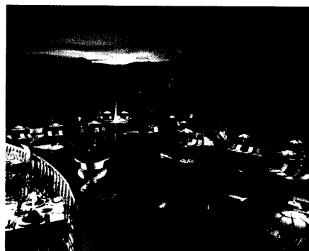
ArabellaSheraton Golf Hotel Son Vida (Seite 80)