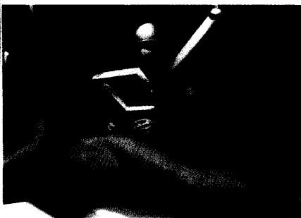
Nur noch indirekt legt der Chirurg bei der Operation Hand an. Das reale Skalpell führt der virtuelle Mediziner Robo-Doc. Seite 58

Personalschulung ist wichtig, aber auch teuer. Wer seine Angestellten in einer In-House-Fortbildung schulen will, sollte sich den Trainer vorher genau ansehen und -hören. Seite 68