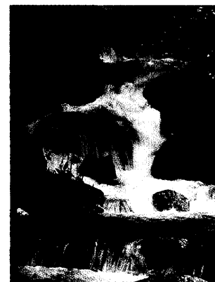
Win-win-Situation: Wer sich einen Kalender der Deutschen Kinderkrebshilfe gönnt, unterstützt damit zahlreiche Projekte, die krebserkrankten Kindern das Leben erleichtern. Seite 69