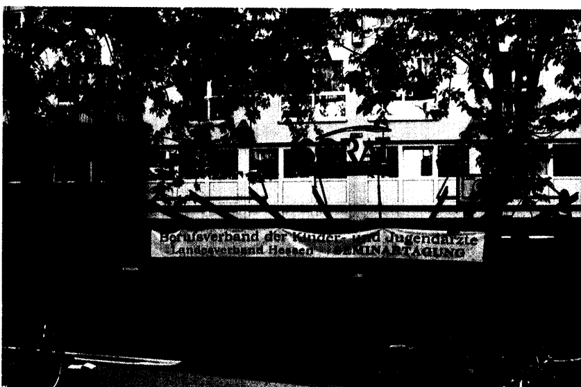
Hessische Kinder- und Jugendärztetagung