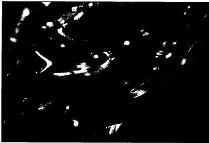
Titelfoto: Blasentang – Fucus vesiculosus von Margot Spohn