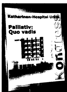
Abb. S. 58