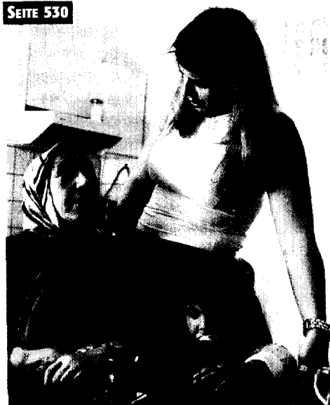
Der Anteil der älteren Migranten wird immer höher.