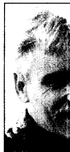
Professor Leland Hartwell vom Fredrickson Cancer Research Center in Seattle

Professor Leland Hartwell aus Seattle hat das Start-Gen für den Beginn eines Zellzyklusses entdeckt. Die Professoren Timothy Hunt und Paul Nurse haben Arbeiten zu der Cyclin-abhängigen Kinase veröffentlicht, der Schlüsselkomponente der Zellzyklus-Regulation. Siehe Seite 10