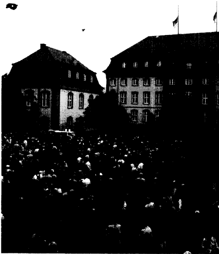
Zeichen der Trauer, der Solidarität und des Gedenkens in der rheinland-pfälzischen Landeshauptstadt: Fahnen auf Halbmast und Schweigegemärsche.