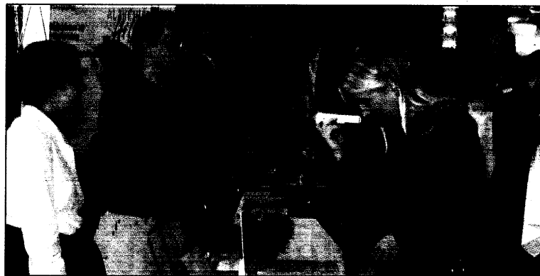
Strategiediskussion am Infostand: Selbsthilfekongreß 2001.

BAD HOMBURG (fuh). Der Zuspruch bei Patienten ist immens, ehrenamtliche Mitarbeiter gehen an Grenzen ihrer Leistungsfähigkeit, Geld, das von der Politik versprochen wurde, bleibt aus: Selbsthilfegruppen stehen vor großen Herausforderungen. Das ist auf dem Deutschen Selbsthilfekongreß deutlich geworden. Siehe auch Seite 4