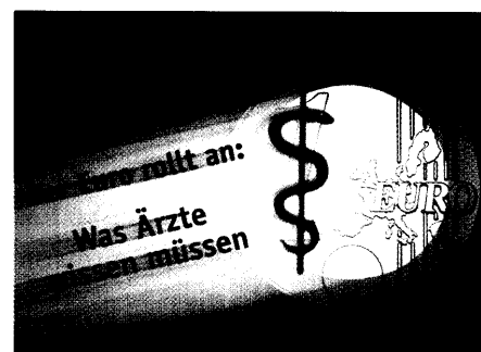
Der Euro kommt

Wichtige Änderungen für Ihre Praxis haben wir für Sie in einer Broschüre zusammengefasst