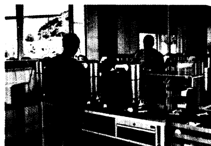
Lieferantenportrait: Bis zu 40 Konzentratoren werden täglich bei der Firma Kröber zusammengebaut.

Vamedis und GloMediX marschieren vereint 54