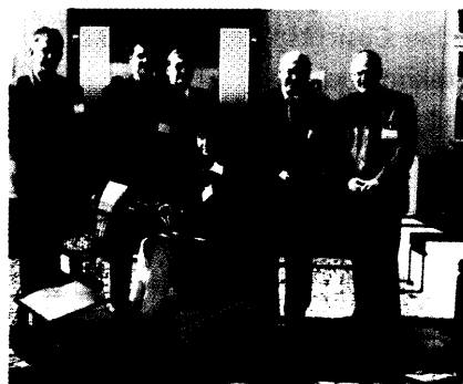
Eröffnen dem Sanitätsfachhandel ein interessantes Marktfeld: Elektromobile

Elektromobile werden eine Leistung der GKV 16