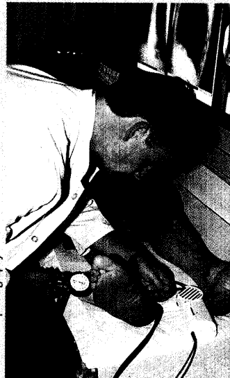
Abb.: Arteria photography