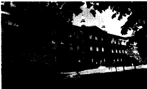
Das Vivantes Krankenhaus Reinickendorf in Berlin.