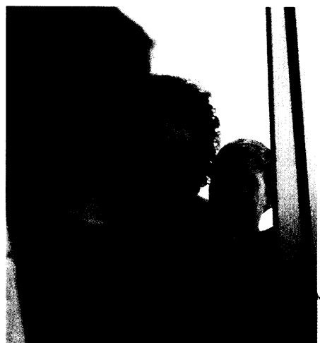
Neue Heilmittel-Richtlinien Bei Logopädie, Ergo- und physikalischer Therapie kontrollieren die Kassen den verordnenden Arzt jetzt stärker