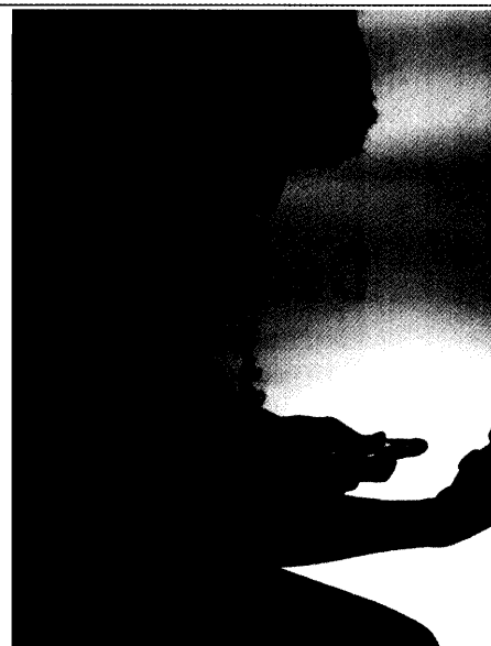
Tödliche Sucht Im vergangenen Jahr starben mehr als 2 000 Süchtige am Drogenkonsum 9