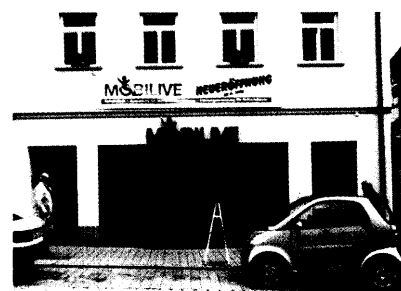
Eine einmalige Kombination von Reha-Fachgeschäft und Autovermietung für Rollifahrer bietet Mobilive in Ravensburg.

Mobilive: Rundum-Service für Rolli-Fahrer 32