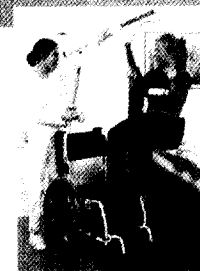
Wandlifter Phoenix I

Fordern Sie unser Informations-Material an!