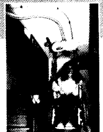
Treppenlift HL 150 Hängeversion