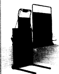
Libby Serie MHP