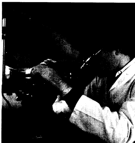
Spermogramm falsch gedeutet Sterilisation misslungen: Wer haftet? Urologe oder Chirurg?