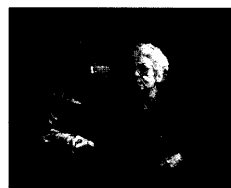
Hilfe und Pflege zu Hause wird zum grössten Teil von Angehörigen erbracht.