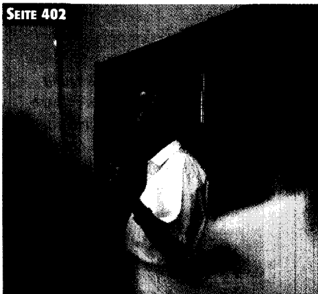
Welche Qualifikation müssen PflegelehrerInnen haben?