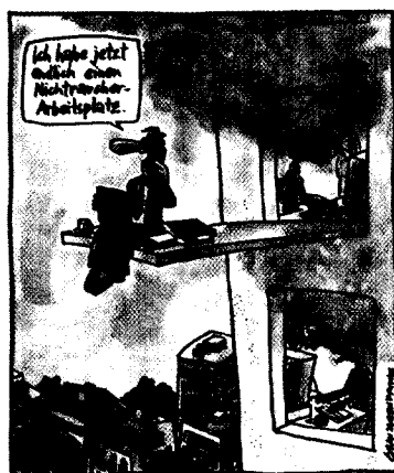
Karikatur: E. Rauschenbach Information: Deutsche Krebshilfe