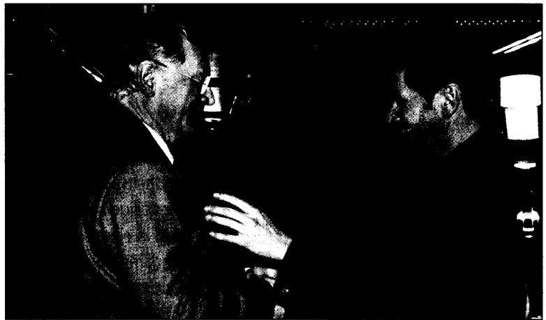
Den Bericht von der konstituierenden VV der KZV Nordrhein finden Sie auf Seite 140