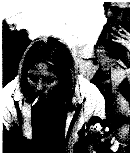
Eingenebelt: Kinder rauchen mit Pädiater sollten Eltern frühzeitig auf die Gefahren des passiven Rauchens aufmerksam machen.