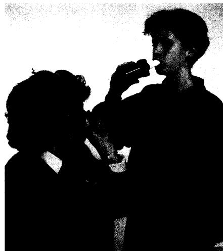
Kontrolle angesagt: Eine Studie zeigt, dass Kinder bei der PEF-Selbstmessung gerne flunkern.