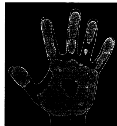
Vorher: Voller Bakterien (Salmonellen, E.coli) ist die Hand, die mit einem Küchenhandtuch hantiert hat.

Eine weitere Liberalisierung der Information ist für rezeptfreie Medikamente geplant: Bislang schränkt eine EU- und eine nationale Krankheitsartenliste die Wer-