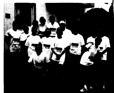
»Just for fun« – Unter den knapp 40 100 Läufern beim Frankfurter Morgan Chase Corporate Challenge waren in diesem Jahr auch 15 Mitarbeiter der ABDA. Seite 70

Am 15. Juni endet die Zeichnungsfrist für die Zentaris-Aktie. Die Aktiengesellschaft, eine Ausgründung der Frankfurter Degussa AG, konzentriert sich auf biotechnologisch hergestellte Arzneistoffe. Immerhin zehn neue Wirkstoffe sind in der Pipeline. Mehr über den Börsenstart auf Seite 60.