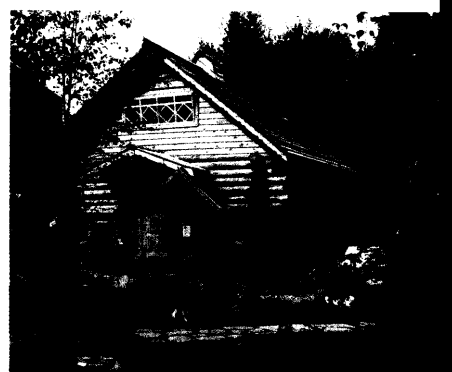
Badegärten Eibenstock 305