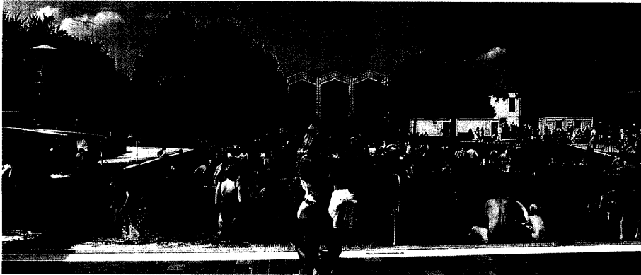
„Münchener Bäder“ mit wachsenden Besucherzahlen 327