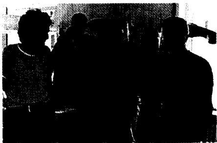
Eine tolle Truppe: sechs Meister und eine Gesellin machen in Bötzingen High-end-Zahntechnik. Seite 1008