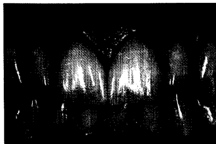
Galvanisch hergestellter Zahnersatz ist äußerst präzise, funktionell, stabil, biokompatibel und erfüllt höchste ästhetischen Ansprüche. Das beweist der hier gezeigte Patientenfall. Zwei Frontzahnkronen wurden mit dem AGC-Galvanoformingverfahren hergestellt und mit Creation verblendet. Lesen Sie ab Seite 1029